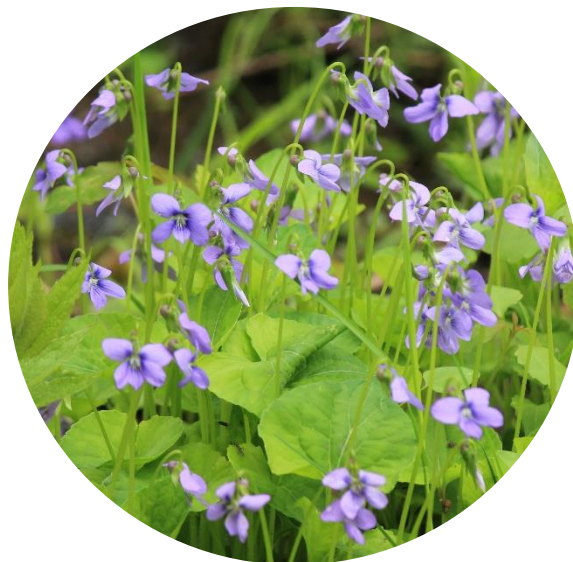
Violet Bleu Laineux