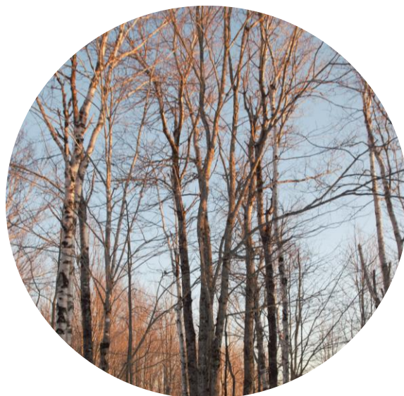
Slippery Mitten

*La propriété est non-exploitée et il existe une variété de dangers et de risques associés à l'accès à cette réserve. Bien que cette réserve soit ouverte à l'accès public, les visiteurs doivent assumer la responsabilité de leurs propres actions et leur sécurité et doivent utiliser le terrain à leurs propres risques.