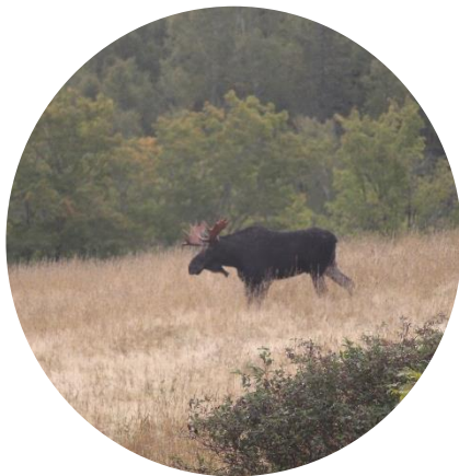
Original, Crédit Photo: A. Beauchamp

Il y a des vestiges d'une usine de traitement du manganèse des années 1930-1940 et d'une érablière, offrant un aperçu de l'histoire de la région. Des sections ont également été utilisées pour la foresterie sélective, jusqu'à ce que l'Elgin Eco Association devienne les intendants en 2002 et a commencé à utiliser les terres pour la conservation et l'éducation. Lorsque l'espace a été vendue pour être coupée à blanc, l'Elgin Eco Association a lancé un mouvement populaire pour conserver la région et le sentier. Grâce à des campagnes, à des collectes de fonds et au partenariat avec la Fondation pour la protection des sites naturels, cet important site du patrimoine naturel et culturel a été conservé à perpétuité en tant que réserve naturelle de la forêt acadienne Mapleton. La Fondation pour la protection des sites naturels est fière de protéger à perpétuité cette part importante des espaces naturels du Nouveau-Brunswick pour les générations futures.