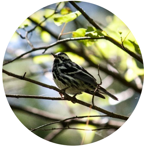
Paruline noir et blanc

Située à Fredericton, la réserve naturelle du parc Hyla est située à 150 promenade Greenwood, derrière l'église baptiste de la promenade Greenwood. La réserve possède un court réseau de sentiers qui serpentent à travers les bois et le long des terres humides. Il y a un stationnement disponible derrière l'église baptiste de Greenwood Drive.